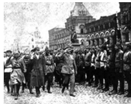
El Ejército Rojo

EJÉRCITO ROJO. Organizado el 27 de febrero de 1918 por León Trotsky cuando fue designado Comisario del Pueblo para la Guerra y cumplió funciones de jefe del ejército revolucionario durante la guerra civil. Fue concebido como "ejército de clase" (de obreros y campesinos) e instrumento del Estado obrero. Adquirió los rasgos de permanente, regular, basado en la conscripción obligatoria, centralizado, sometido a una autoridad única, los mandos militares estaban subordinados a los comisarios políticos que eran representantes del poder soviético. Ideológicamente fue moldeado por el Partido Bolchevique. En 1935 Stalin introdujo el sistema de grados, desde subteniente hasta mariscal.